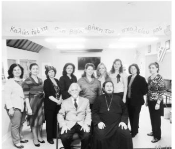
Από τη βιβλιοθήκη του Ελληνικού σχολείου της Αναλήψεως, Fairview, NJ