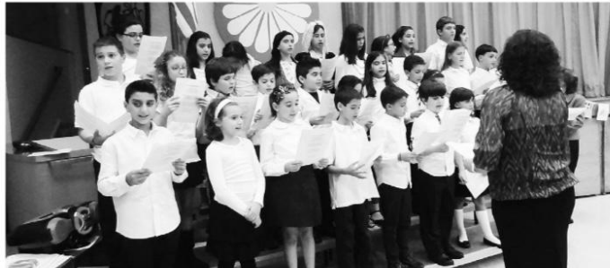
Με την χορωδία του σχολείου στο Fairview, NJ