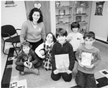
Από τη βιβλιοθήκη του Ελληνικού σχολείου της Αναλήψεως, Fairview, NJ