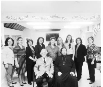
Από τη βιβλιοθήκη του Ελληνικού σχολείου της Αναλήψεως, Fairview, NJ