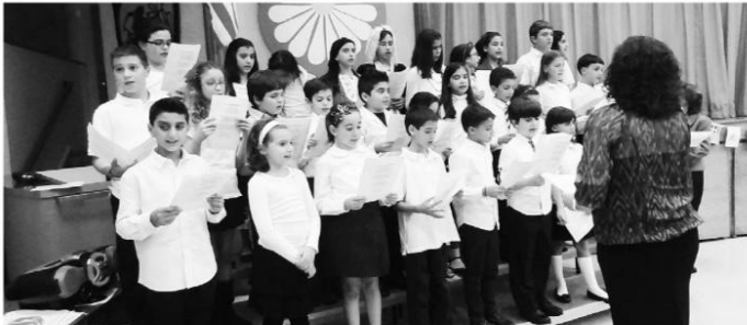
Με την χορωδία του σχολείου στο Fairview, NJ